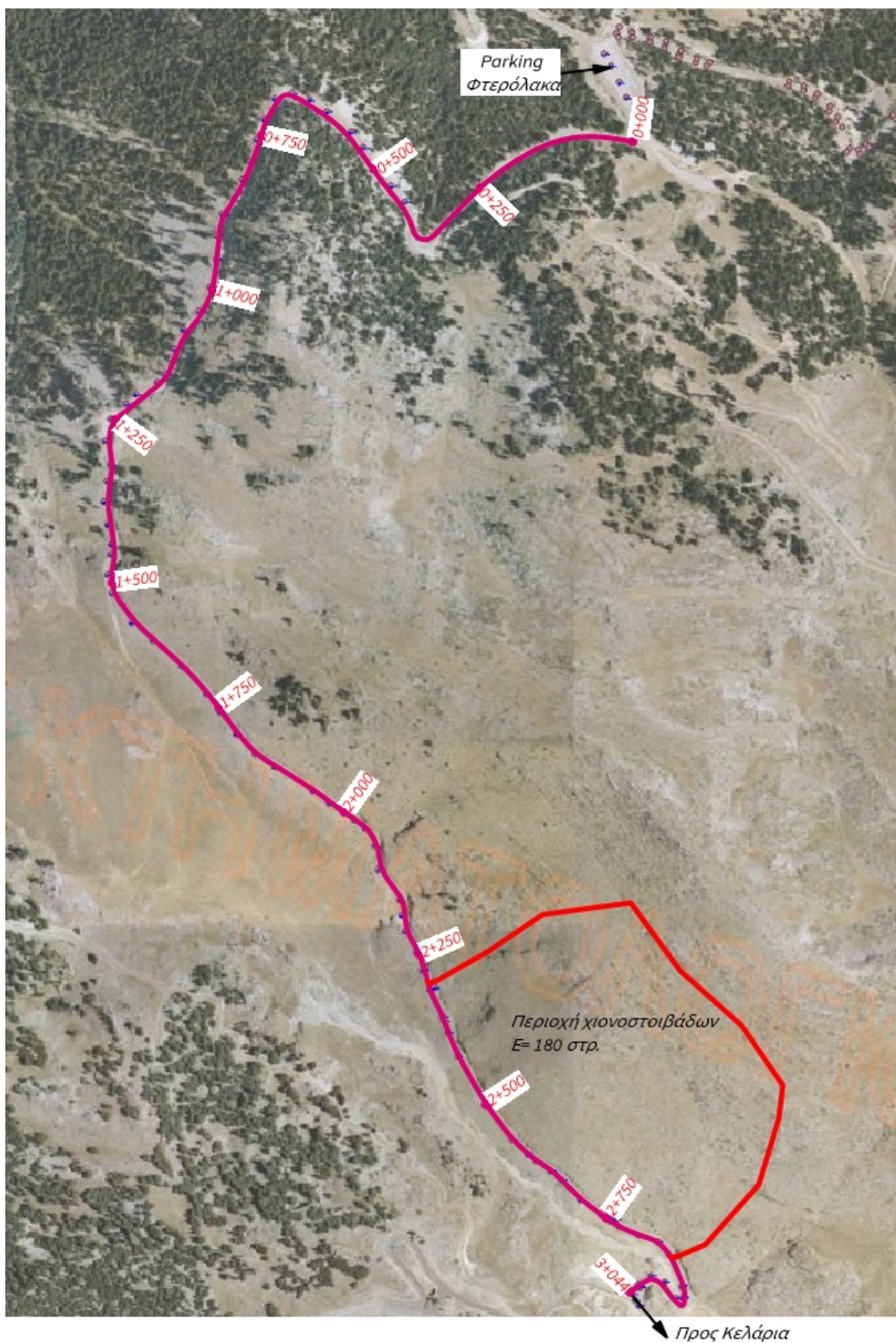
Σχήμα 2. Δημοτική οδοποιία Φτερόλακας 1650 – Κελάρια 1750 / διασταύρωση