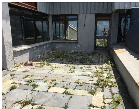
16. Δάπεδο εξώστη αιθρίου με έντονα σημάδια υγρασίας που διαβρώνουν τη υποκείμενη πλάκα σκυροδέματος