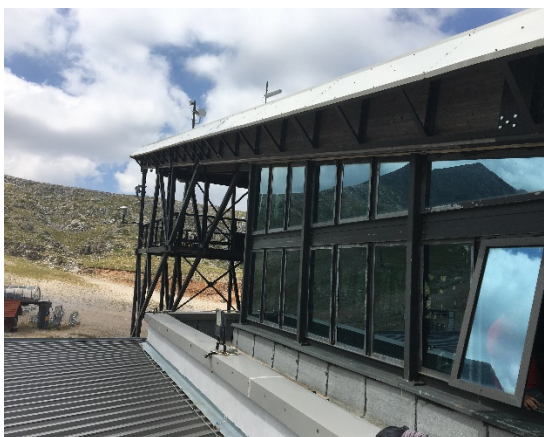
13. Απουσία πλαϊνής επικάλυψης ανατολικής όψης που αφήνει εκτεθειμένη την ακραία ξύλινη δοκό.