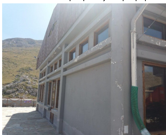
28. Διακοσμητικά στοιχεία όψης που πρέπει να επισκευαστούν