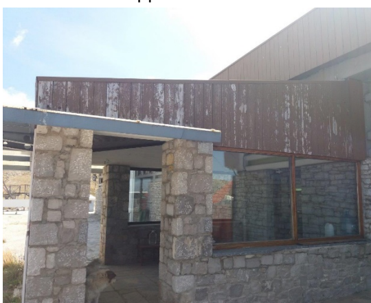
27. Τμήμα της ξύλινης επένδυσης που πρέπει να αντικατασταθεί με τραπεζοειδή λαμαρίνα