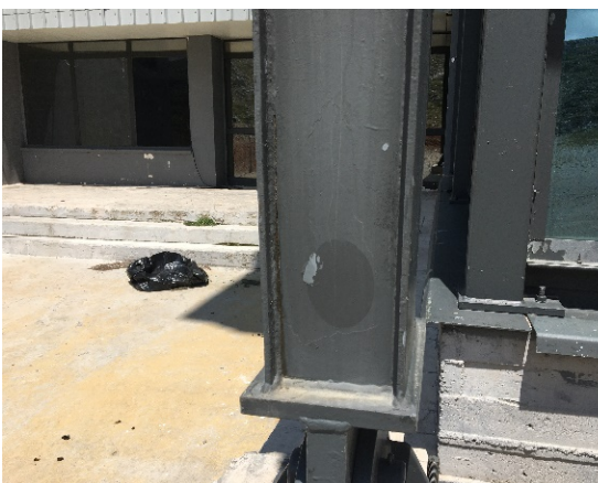
10. Τοπική διάβρωση ακραίου μεταλλικού υποστυλώματος δυτικής πλευράς