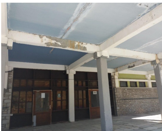
21.Τμήμα οροφής ισογείου στοάς. Διαβρωμένα δοκάρια και οροφή.