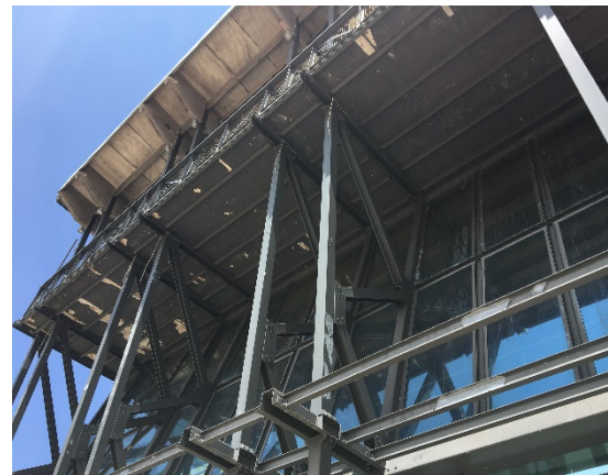
6. Εξωτερικά ζεύγη υποστυλωμάτων στο ύψος του εξώστη