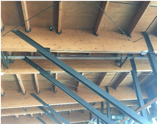
3. Σύνδεση υποστυλωμάτων με τους δοκούς σύνθετης ξυλείας