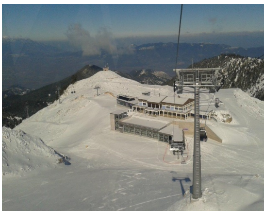
19.Γενική άποψη σαλέ Φτερόλακας από τον αναβατήρα Ηνίοχου.