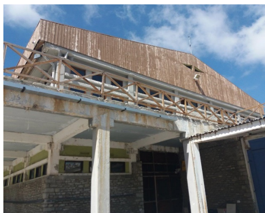
22.Σημεία έντονης ενανθράκωσης οπλισμού λόγω απουσίας «νεροσταλάκτη». Φθορές στη ξύλινη επένδυση της στέγης.