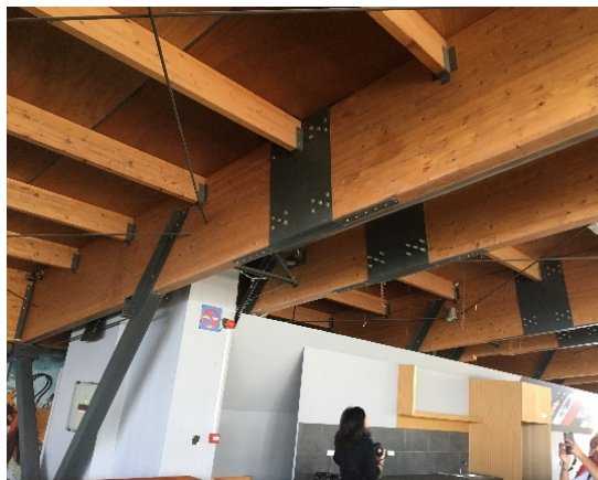
8. Αντιανέμια της βόρειας πλευράς