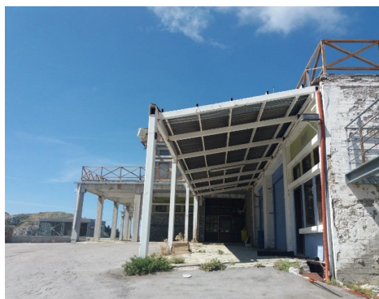
29. Διαμόρφωση νεροσταλάκτη σε υφιστάμενη επένδυση οροφής που πρέπει να επαναληφθεί με στοιχεία λαμαρίνας.