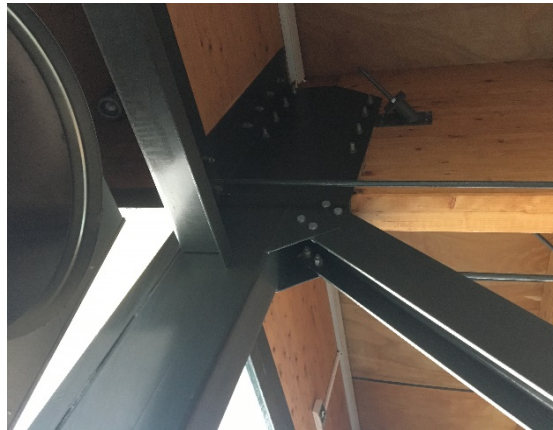
4. Πρότυπος κόμβος υποστυλώματος με δοκό