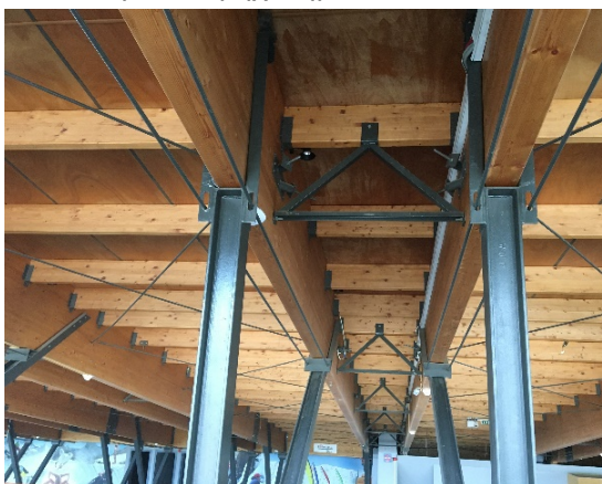
9. Αντιανέμια της νότιας πλευράς