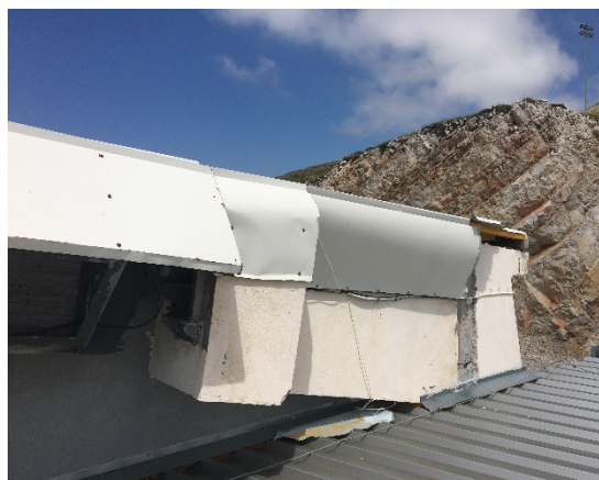
14. Πρόχειρες επισκευές επικάλυψης που πρέπει να αντικατασταθούν με σταθερά φύλλα γαλβανισμένης λαμαρίνας.