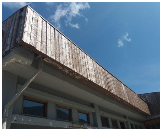
26. Τμήμα της ξύλινης επένδυσης που πρέπει να αντικατασταθεί με τραπεζοειδή λαμαρίνα