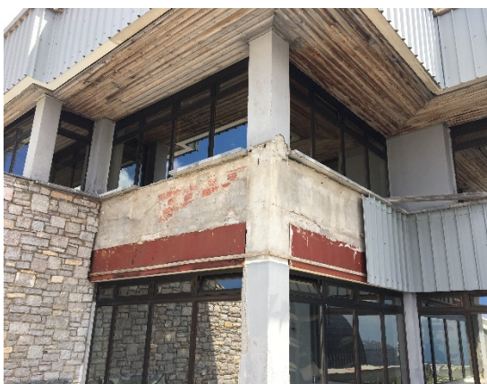
15. Φθαρμένα δομικά στοιχεία (διαζώματα, οροφή) στη περιοχή του δυτικού αιθρίου που χρήζουν αποκατάστασης.