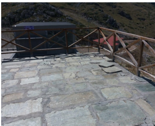
25. Αποξήλωση πλακών λόγω συστο- διαστολών του αρμού.