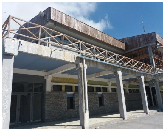
20.Τμήμα της νότιο-δυτικής στοάς με έντονα τα σημάδια διάβρωσης στα δομικά στοιχεία του Φ.Ο. και κιγκλιδώματα..