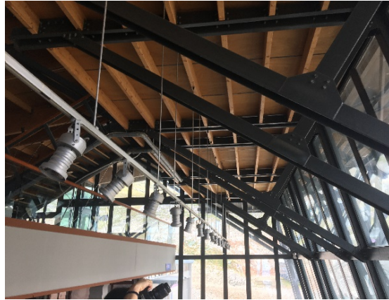
2. Στήριξη επιστέγασης