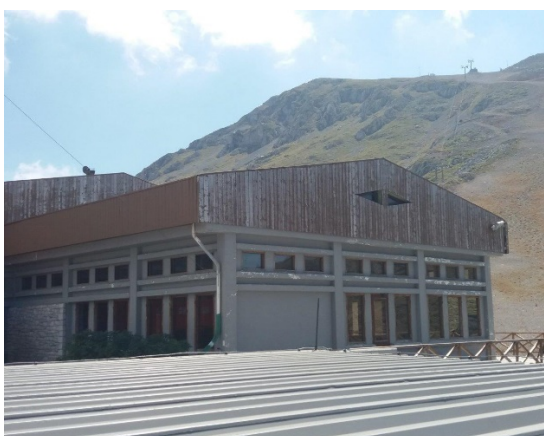
23.Τμηματική άποψη της βορειο-δυτικής γωνίας του σαλέ. Φθορές στη ξύλινη επένδυση της στέγης.