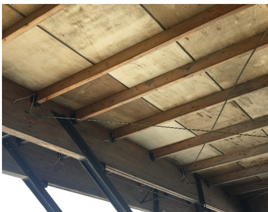
11. Δοκοί και κόντρα πλακέ θαλάσσης που χρήζουν συντήρησης