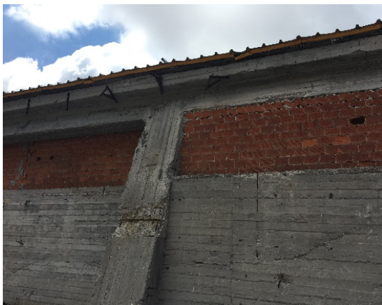
7. Υποστύλωμα βόρειας πλευράς. Διακρίνονται τοπικές φθορές από διαστρωτικό μηχάνημα.