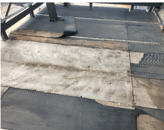
12. Κόντρα πλακέ θαλάσσης εξώστη. Προτείνεται να αντικατασταθεί από ξυλεία ίσοκο πάχ.4,5 εκ. με πλάτος σανίδας 20 εκ.