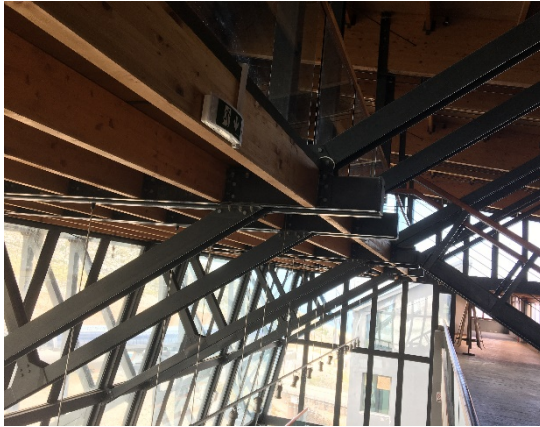
1. Στήριξη εσωτερικού παταριού